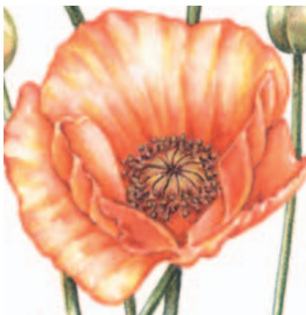
Potlood op papier

Door met het potlood een palet van kleuren op een restje grof aquarelpapier aan te brengen, kun je mengen uittesten en is het resultaat vloeiender en het potlood minder zichtbaar op het papier.