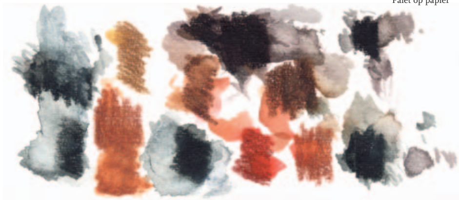
Palet op papier

Door met het potlood een palet van kleuren op een restje grof aquarelpapier aan te brengen, kun je mengen uittesten en is het resultaat vloeiender en het potlood minder zichtbaar op het papier.